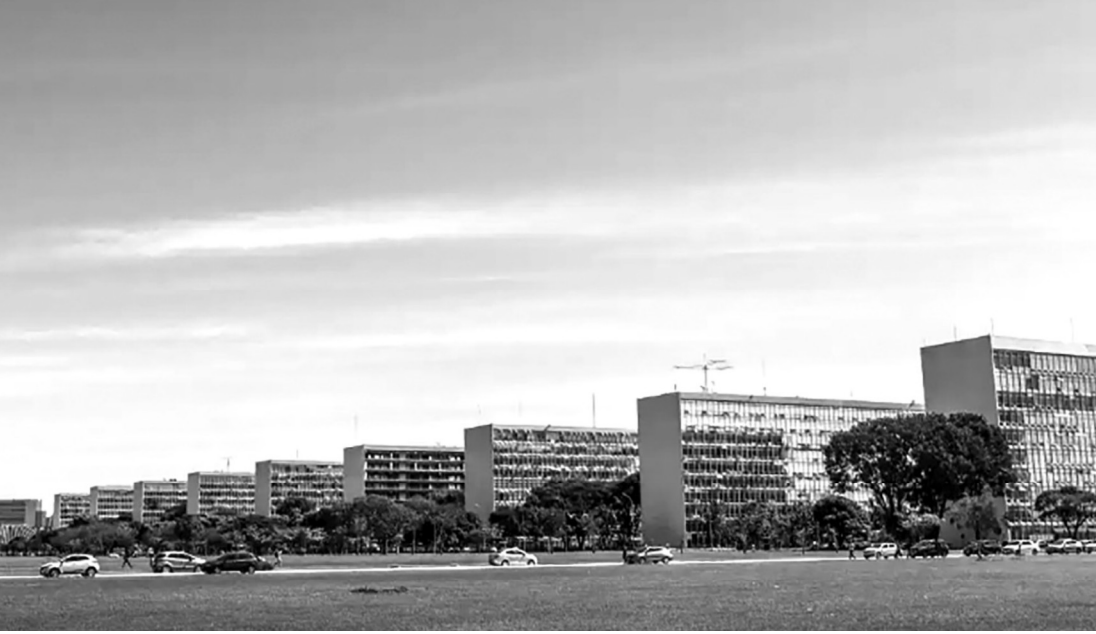
A queda no bloqueio decorre principalmente do cancelamento de R$ 3,8 bilhões em despesas discricionárias

A equipe econômica reduziu o volume de recursos congelados no Orçamento de 2025, aliviando parte da pressão sobre a máquina pública em meio ao esforço para cumprir a meta fiscal do próximo ano. Segundo o Relatório de Avaliação de Receitas e Despesas Primárias do 5º bimestre, divulgado pelo Ministério do Planejamento e Orçamento, o montante total de verbas indisponíveis caiu de R$ 12,1 bilhões para R$ 7,7 bilhões. Desse valor, R$ 4,4 bilhões permanecem bloqueados e R$ 3,3 bilhões foram contingenciados.