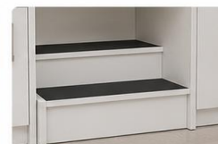
ESCALADA DE DOIS DEGRAUS Espaço central com escada de dois degraus, proporcionando mais segurança e acessibilidade.