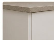
ACABAMENTO MELAMÍNICO MDF 18 mm com acabamento melamínico de alta qualidade, resistente à umidade, fácil de limpar e de longa durabilidade.