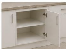
OITO PORTAS Oito portas com dobradiças metálicas de alta qualidade, que asseguram resistência e maior vida útil.