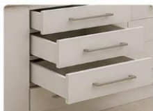
QUATRO GAVETAS CENTRALIZADAS Quatro gavetas espaçosas e centralizadas, com corredeiras metálicas que garantem abertura suave e durabilidade.