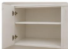
PRATELEIRAS INTERNAS Prateleiras internas que proporcionam melhor organização e aproveitamento do espaço.