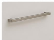
PUXADORES EM ALUMÍNIO Puxadores em alumínio com design moderno, oferecendo resistência, praticidade e um acabamento sofisticado.