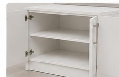
PORTAS COM DOBRADIÇAS METÁLICAS Maior resistência e durabilidade, com abertura ampla para melhor acesso interno.