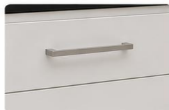
PUXADORES EM ALUMÍNIO Puxadores modernos em alumínio, proporcionando resistência, praticidade e acabamento de alta qualidade.