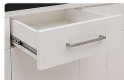
GAVETAS COM CORREIÇAS METÁLICAS Deslizamento suave e silencioso, proporcionando mais praticidade no dia a dia.