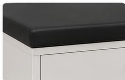
ESTOFADO CONFORTÁVEL Espuma de alta densidade revestida em couvrin resistente, fácil de limpar e com excelente durabilidade.