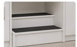
ESCALA DE DOIS DEGRAUS Espaço central com escada de dois degraus, proporcionando mais segurança e acessibilidade.