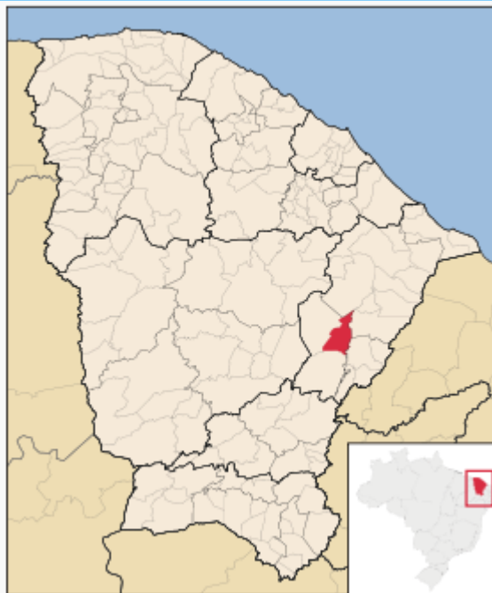
Localização de Jaguaribara no Ceará